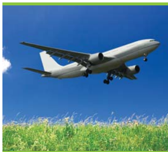
GYORSÍTÓSZÁV IV. Kihívások és lehetőségek – A maradék 3400 milliárd Ajánlás a fejlesztési források hatékonyabb felhasználásához 2010.03.22.